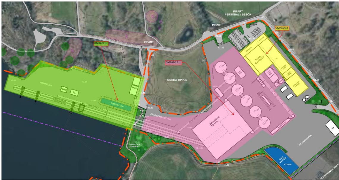
Figur 3 Indelning i släckområden inom anläggningen.