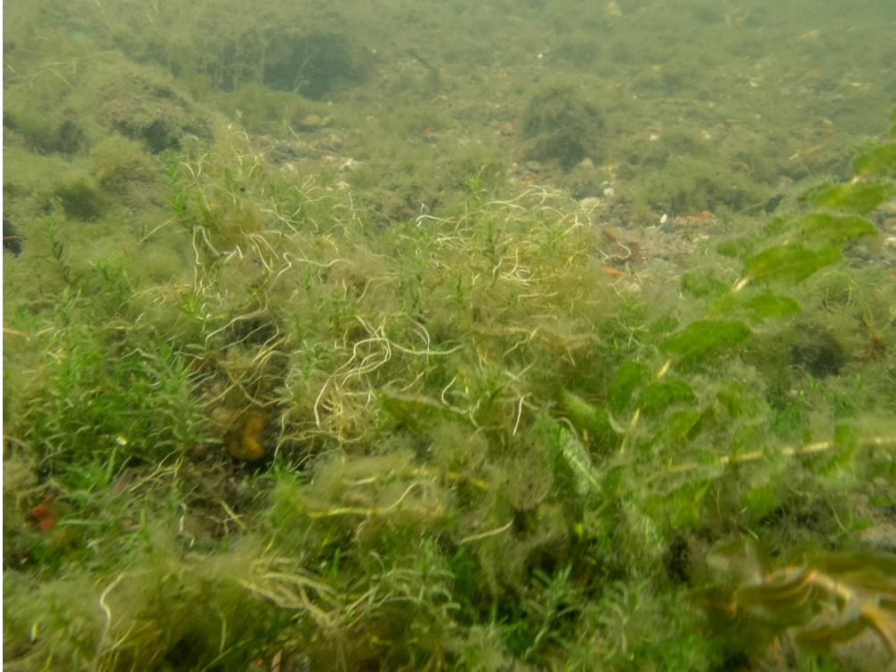
Figur 3. Höstlånke ( Callitriche hermaphroditica ) och ålnate ( Potamogeton perfoliatus ) vid transekt Lit 3.