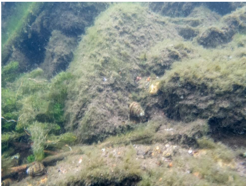
Figur 2. Transekt Lit3: block täckta av getraggsalg ( Aegagropila linnaei ) och till vänster smal vattenpest ( Elodea nuttallii ). På lokalen fanns det även gott om snäckor som trubbsumpsnäckan ( Viviparus viviparus ).

Spår av mänskliga aktiviteter sågs vid Lövesta lokalerna. För Lit 2 noterades exempelvis cykeldäck och annat bråte längs transekten. Nedan redovisas resultat för samtliga inventerade transekter vid Lövesta och Färingsö.