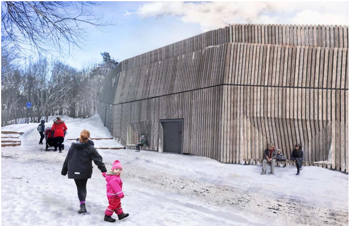
Den nya pumpstationen i Hammarbybacken. Bilden är ett fotomontage. (Illustration: Urban Design)